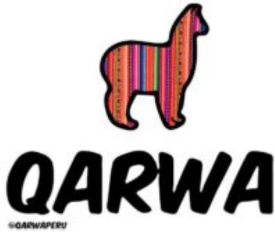
Logo de Qarwa